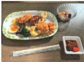
矢巾町のここかむ食堂さんのバイキングの一部にご使用頂きました。

岩手日報社さんに冷凍ストッカーを桜山神社さんの境内の一角に置いて頂きました。そこにモリレイが商品を納入、各こども食堂が取りに来る、という流れで進めています。