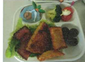
インクルこども食堂さんのクリスマス行事食の一部にご使用頂きました。