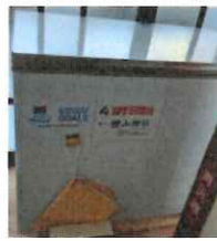
岩手日報社さんに設置して頂いた食材保管用のストッカー。桜山神社さんに置いてあります。