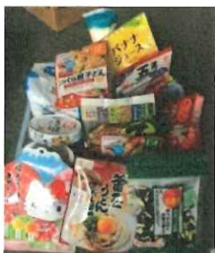
モリレイ社員から集まった一部。他にもたくさん集まりました！

メーカーさんからのご協力、モリレイ滞留在庫、モリレイ社員からは募集をかけて集め、寄付しています。